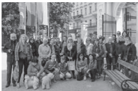
Viedenský Slováci pod vlajkou Lichtenštajnska