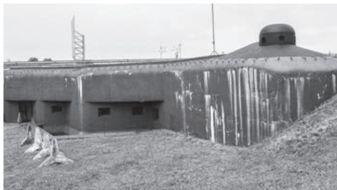
Pechotný zrub "Na trati" - zvonku vidno len jednu štvrtinu objektu

Ako sa vyjadrili tvorcovia projektu, cieľom Technotrasy je ponúknuť zaujímavé aktivity, približujúce život a príbehy šikovných ľudí, ktorí pretvárali svojimi rukami a svojím srdcom dary prírody ich regiónu na ušľachtilú krásu. Azda aj preto je logom Technotrasy neopracované srdce, vnútri ktorého sú spojnice niektorých pamiatok na mape. ■