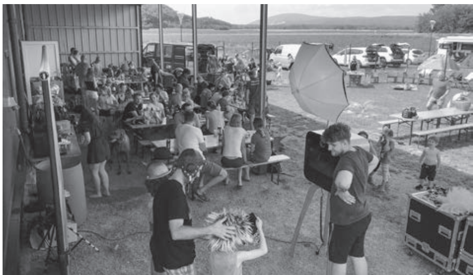
Fotokútik v plnom nasadení