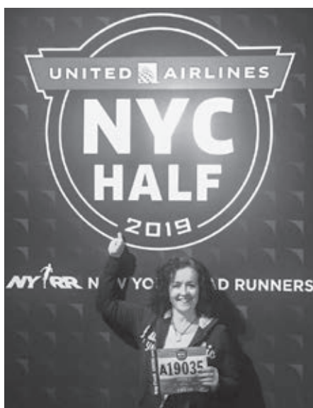
Vyzdvihnutie štartovného čísla

Štartovali sme v Brooklyne v Prospect parku, bežali sme cez Manhattaný most (na ktorý sa normálne dostanete len autom, takže to bol dôvod aj na fotku), z mosta sme odbočili doprava a pár kilometrov bežali popri rieke Hudson až po 42. ulicu. Tam sme odbočili doľava a bežali po 7. ulicu. Tí čo už v NY boli, zrejme vedia či tušia, že v tomto momente sme sa nachádzali