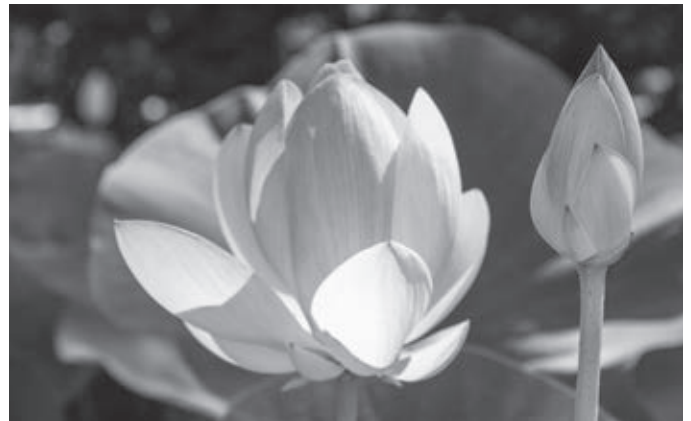
Mystický lotos indický

Na počesť otca a syna Jacquinovcov je malý kúsok botanickej záhrady pomenovaný „Jacquinhain“ – hájok Jacquinovcov. Dominantou sú ich náhrobné kamene prenesené z pôvodného miesta z cintorína v Matzleinsdorfe.