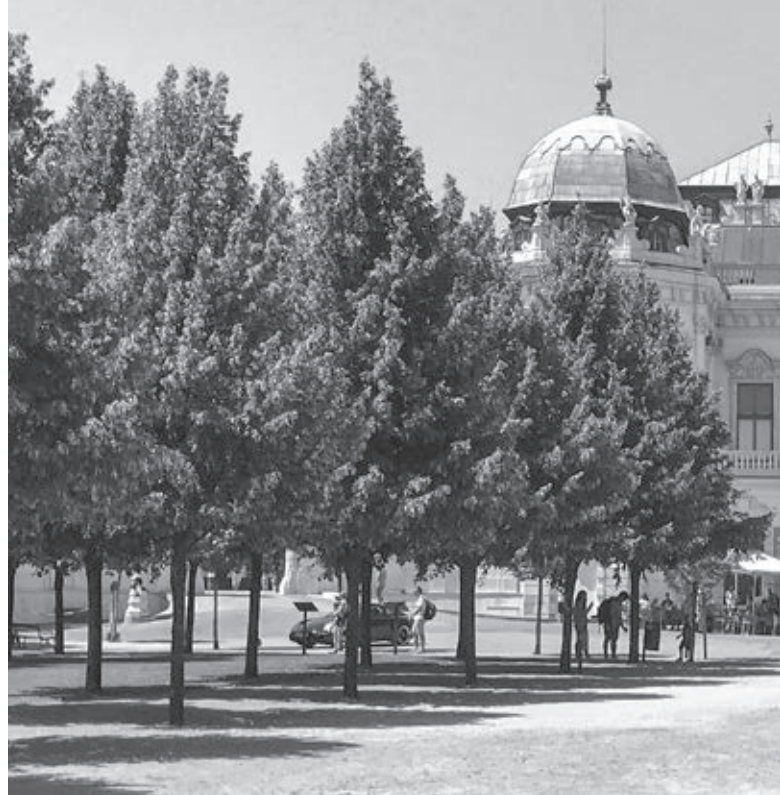
Pohľad od jedného z východov botanickej záhrady