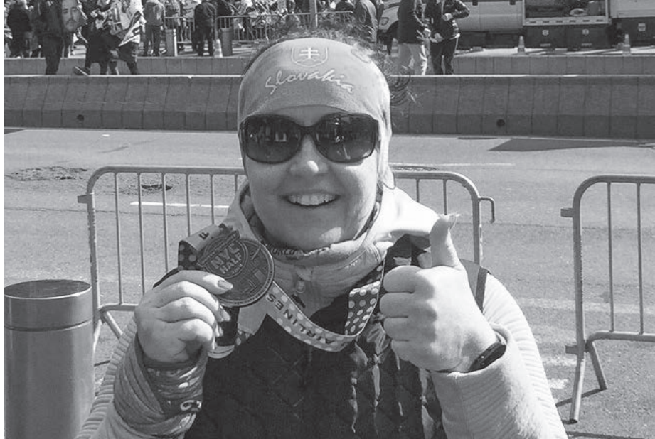
V čelí s pamätnou medailou a šťastným úsmevom

Hovorí sa, že sny sa majú plniť – tým mojím bolo vždy ísť do New Yorku. Keď sa povie NY, každému sa vybaví zrejme niečo iné. Nieкто si predstaví Sochu slobody, vysoké mrakodrapy, nieкто Times Square, Brooklynský most, hamburgery s hranolčkami, iný zase seriál Sex v meste a športuchtiví ľudia si vybavajú Central Park a určite aj legendárny newyorský maratón, ktorý má dlhoročnú tradíciu. Ja som bola v New Yorku trikrát, naposledy v marci tohto roku, keď som si splnila svoj "bežecký" sen, a práve o ňom budú nasledujúce riadky.