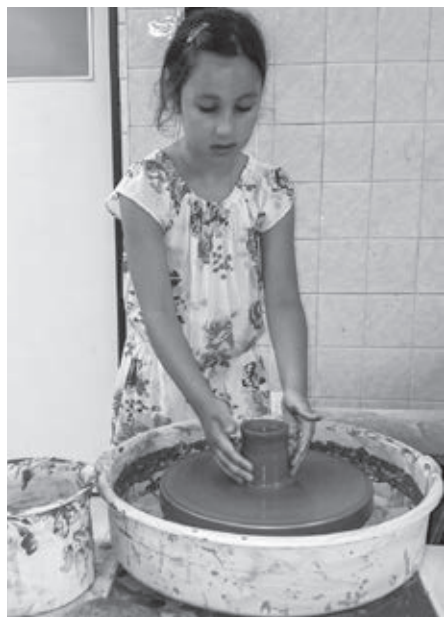
Skúška hrnčiarkej zručnosti v Modre