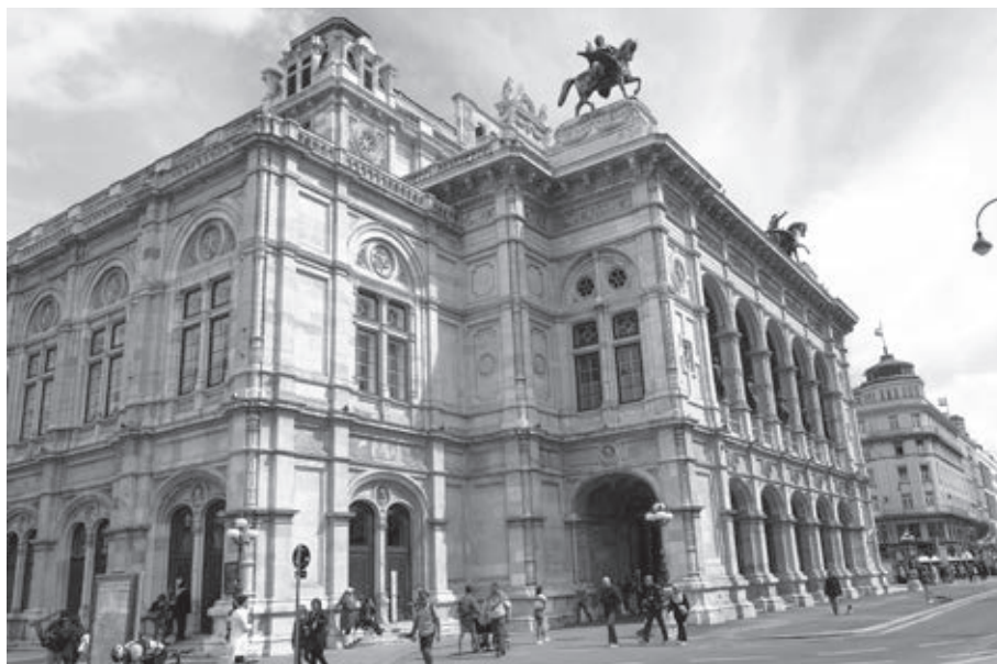
Kedysi nepochopená, dnes obdivovaná budova Štátnej opery

Nová divadelná sezóna sa už neotvorila, minister propagandy Joseph Goebbels dal po lete zavrieť všetky divadlá na území Veľkonemeckej ríše. Ale to ešte nebol koniec. 12. marca 1945 americké letectvo počas náletu, ktorý mal pôvodne smerovať na rafinérie vo Floridsdorfe, zasiahlo budovu opery. Ostala iba jej predná časť, ktorá bola už predtým z bezpečnostných dôvodov zamurovaná. Zachoval sa tak len hlavný vchod, vestibul, schodisko, cisársky salónik a lodžia s freskami Moritza von Schwinda, ktoré znázorňujú výjavy z Mozartovej Čarovnej flauty. Všetky ďalšie časti zničil požiar. Po skončení vojny sa viedli dlhé diskusie, či ťažko poškodenú stavbu zbúrať alebo zrekonštruovať. Napokon sa predsa len presadila rekonštrukcia, a to do podoby blízkej pôvodnému stavu. Tóny klasickej hudby, konkrétne z Beethovenovej opery Fidelio, sa po dlhoročnej prestávke opäť rozozvučali 5. novembra 1955, len pár mesiacov po tom, ako