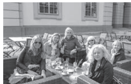
Posedenie na nádvorí záhradného paláca