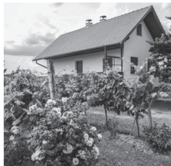
Typický Kellerstöckl uprostred vinohradov