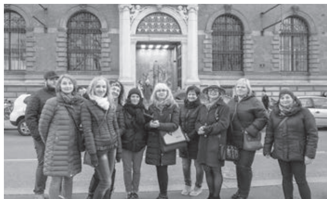
Pred bránou do múzea