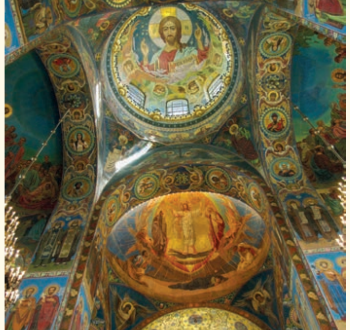
Sobor (Chrám) Kristovho vzkriesenia