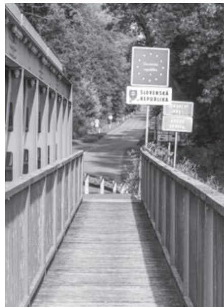
Most Hohenau - Moravský Svätý Ján