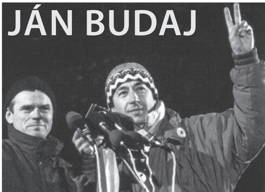
November 1989 - Ján Budaj (vpravo) a Milan Kňažko na tribúne na Námestí SNP

Vydávanie samizdatov, spolupráca s tajnou cirkvou a ďalšími občianskymi iniciatívami, najmä s Chartou 77 ťa učili sledovať veci