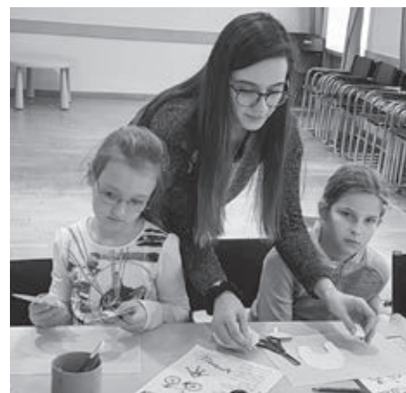
Na hodine slovenčiny

Nedávno som bola v kine v Bratislave na novej verzii filmu Aladinova lampa, čiže film bol v slovenčine. Nenápadne som pozorovala svoju dcéru a rozmýšľala, či naozaj rozumie všetkým slovám a významom. Úplne zahľbená do filmu