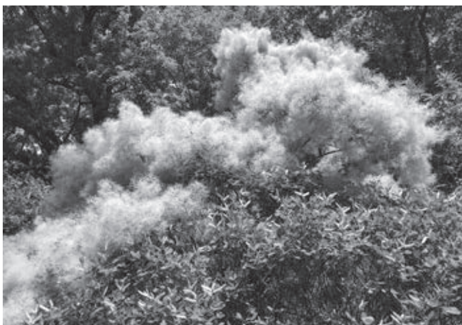
Strom pripomínajúci páperie

Botanická záhrada susedí s kláštornou záhradou pri Kostole Matky Božej Muttergotteskirche na ulici Jaquingasse, v ktorom sa každú nedeľu večer konajú sv. omše v slovenskom jazyku. Záhrada s oblúkmi ruží ako v rozprávke o Šípkovej Ruženke je doplnená malou Lurdskou