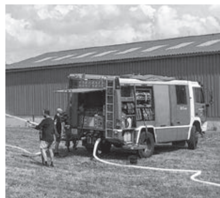
Príprava vodnej steny na osvieženie