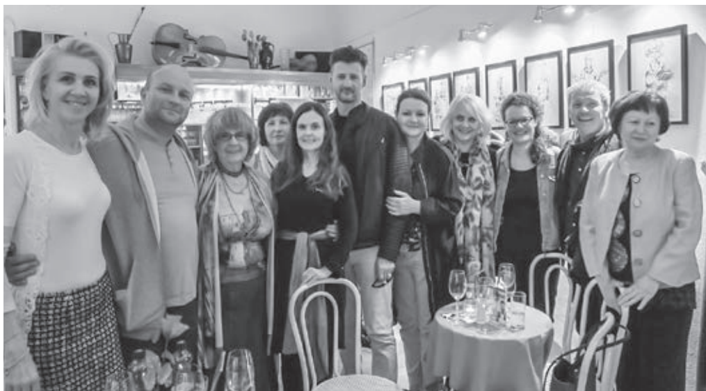
Hlavní protagonisti, hostia a organizátori večera

Veľmi príjemné bolo, že po predstavení si herci posedeli v kruhu svojich priaznivcov a zodpovedali zvedavé otázky. Porozprávali o aktuálnych projektoch v televízii či v divadle, s ochotou zapožovali na spoločných selfie a odkryli nám okrem umeleckého aj svoj ľudský rozmer. ■