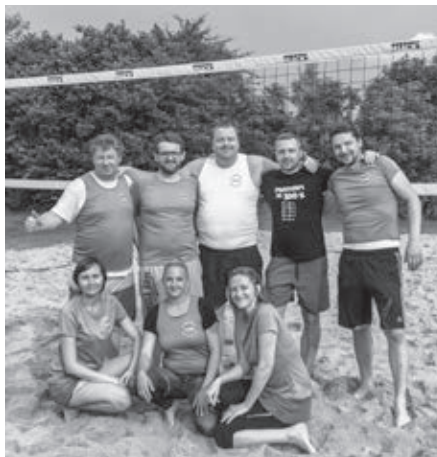
Víťazný team Marchegg

príjem, nahrávka, smeč – lopta lietala z jednej strany na druhú, hráči sa obetavo hádzali do piesku, žiadna lopta nebola stratená a diváci hlasno hnali svojich vpred. Tvrdý a húževnatý odpor hostí nepomohol a zápas sa skončil výhrou Marcheggu. Domáci sa hneď postavili na druhý zápas proti partii z Hainburgu. Zabojovali a aj tohto súpera, napriek ich statočnému