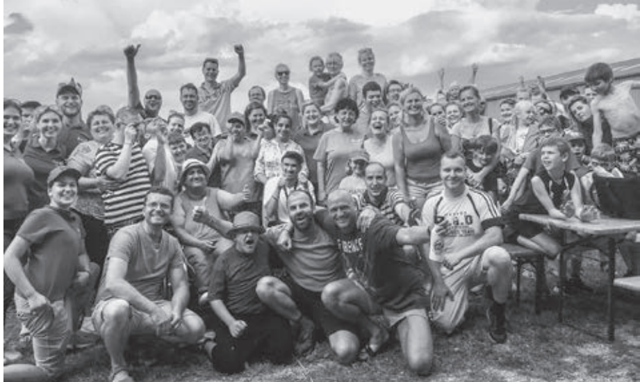
Už sa všetci tešíme na budúcu stanovačku!

Na schladenie a osvieženie sa servirovala výborná zmrzlina od Eissaloon Daniel