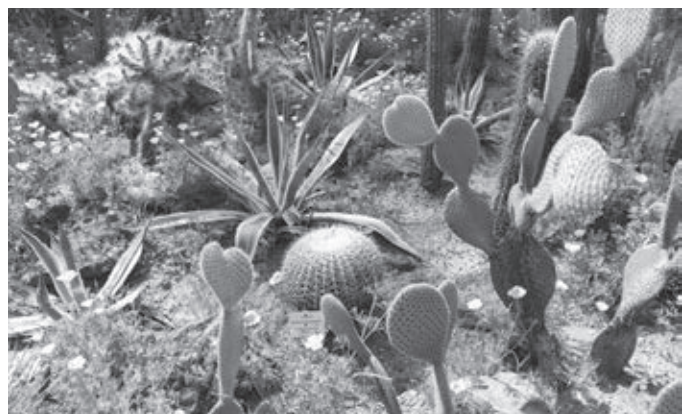
Kaktus so srdiečkovými listami

Botanická záhrada vo Viedni má rozlohu iba 8 hektárov. V porovnaní s bratislavskou botanicou záhradou, ktorá je 60-hektárová, jej možno dať prívlastok mini. Avšak má zaujímavú históriu, lebo bola založená už za panovníčky Márie Terézie v roku 1754. Má teda 265 rokov a tá v Bratislave iba 77. Radcom Márie Terézie aj v tejto oblasti bol Gerard Van Swieten, riaditeľ lekárskej fakulty Viedenskej univerzity. Inšpiroval sa inými európskymi