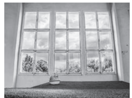
Piknikový trávnik s košíkom plným kvízových otázok