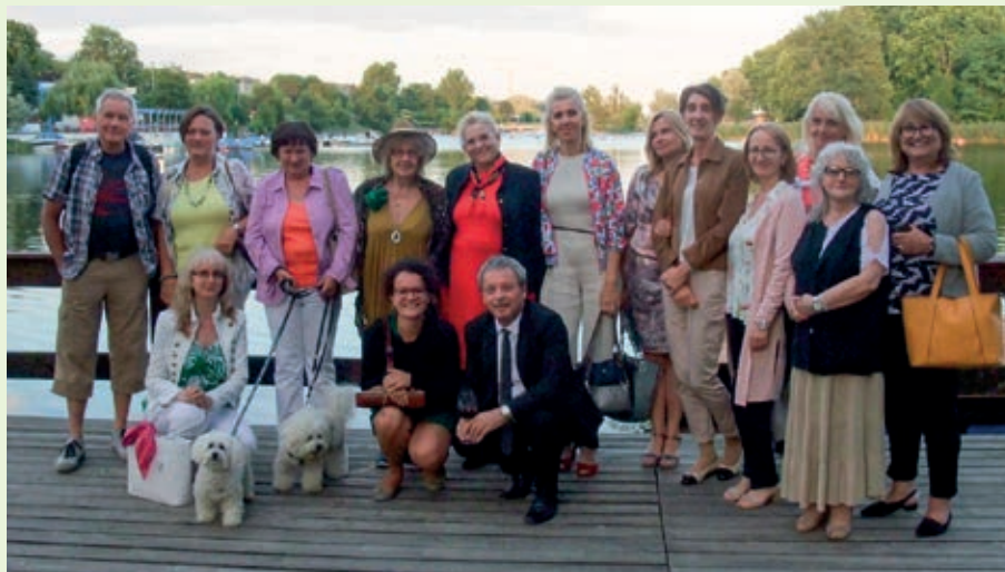
Oslávankyňa a jej gratulanti