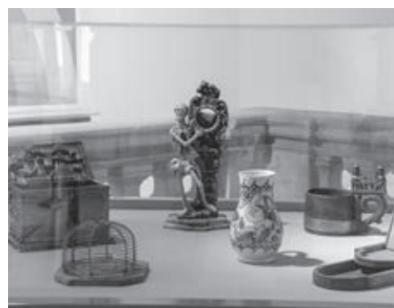
„Dúhová rodina“ – exponáty symbolizujúce hlavné témy výstavy