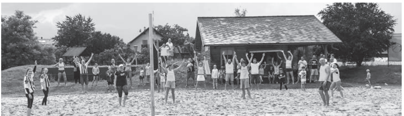
Úžasná atmosféra počas turnaja

Nedeľné turnajové popoludnie bolo skvelou príležitosťou stretnúť sa nielen na kultúrno-spoločenských, ale aj na športových podujatiach. A) podľa predbežných dohôd to nebude v budúcnosti iba volejbal... Už počas turnaja to len tak hýrilo nápadmi, kedy a kde sa zasa stretneme a zabavíme. B) Bude to na futbale vo Wolfsthale a floorbale v Hainburgu. Už teraz sa tešíme na zábavu a partiu úžasných susedov! ■