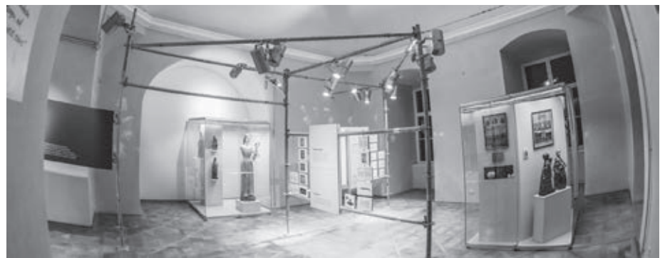
Bývala zámocká kaplnka, teraz výstavný priestor

Výstava je otvorená od 4. mája do 15. novembra 2019 denne okrem pondelka od 9.30 do 16.00 hod.