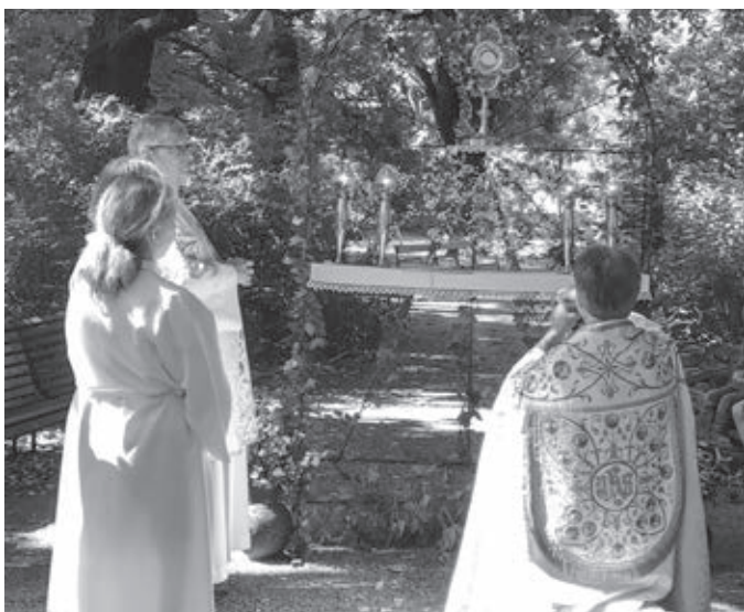
Sviatosť oltárna v monštrancii ozdobenej čerstvými kvetmi

Prospekty: „Der Endlicher-Fenzl-Kerner-Weg“, „Botanischer Garten 2019“ (Botanischer Garten der UniWien, Rennweg 14, 1030 Wien)