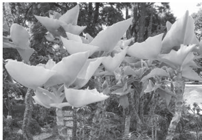
V oddelení sukulentov

rozrástol a pozýva hlbšie do svojho vnútra. Tropický dom – Tropenhaus chráni v chladnom období zvláštne tropické rastliny a ako jediný zo 17 skleníkov je prístupný verejnosti. Na prechádzku sa môžete vydať od Veľkej noci do októbra, keď je vstup do botanickej záhrady voľný.