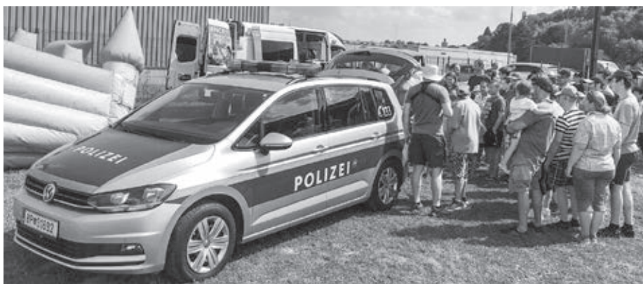
Veľký záujem o prácu policajtov u malých aj veľkých

Večer sa spustil ľahký dáždič, pomaličky padala tma a to bol čas na premietanie rozprávky pre deti. Po nej už tradične čakal deti „chodník odvahy“, čoho sa už nevedeli dočkať. Niektorí odišli spať domov do svojich postieľok a niektorí ostali spať v stanoch až do nedeľného rána. Opäť to bola krásna akcia, ktorá obohatila nás všetkých! ■