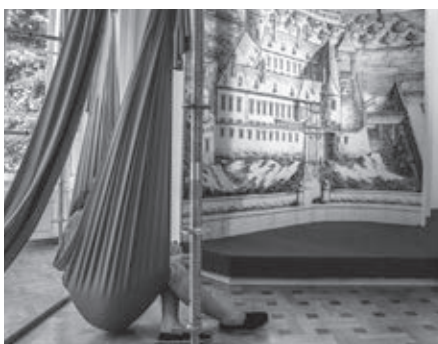
Kópia rytiny kaštiela zo 17. storočia a hojdačie siete na výhľad z okna