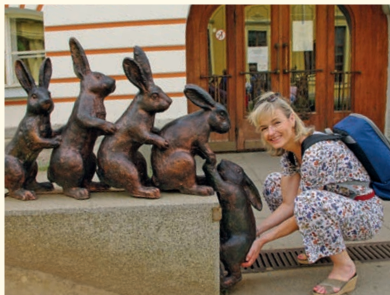
Petropavlovská pevnosť stojí na ostrove, ktorý sa volá Zajačí

Pobyt v Petrohrade ma zmieril s mojou ruštinárkou. Niektoré slová som ešte vykoktal, no a hlavne – toto mesto si treba pozrieť ešte raz! ■