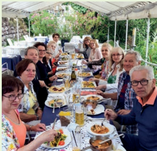
Večer plný dobrého jedla a veselých spomienok