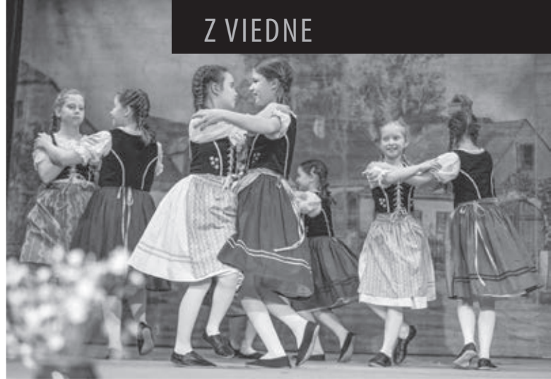
Vo víre tanca