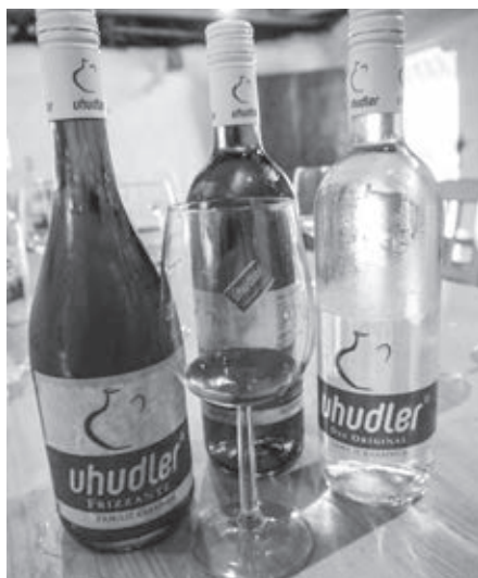
Uhdler - unikát z južného Burgenlandu

Južný Burgenland patril k najchudobnejším častiam Rakúska. Na jednej strane sa síce chváli 300 slnečnými dňami v roku, ale v skutočnosti sú tu veľmi teplé a suché letá a zimy, hoci teplota