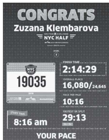
Štatistické vyhodnotenie behu