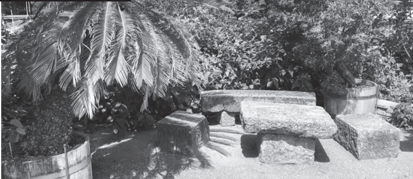
Kamenná lavička pozýva sadnúť si do tieňa palmy

Napriek spomenutým stratám je v botanickej záhrade ešte čo obdivovať. Práve teraz v lete vykúka v jazierku spod obrovských listov pastelovo sfarbený lotosový kvet. Aloe, agáve aj kaktusy sa tešia horúcemu počasiu a prezentujú kvety sýtych farieb. 850 stromov zastupuje 600 druhov drevín a poskytuje príjemný tieň. Vysokánske sekvoje aj mamutie stromy vzbudzujú náš rešpekt, bambusový háj sa