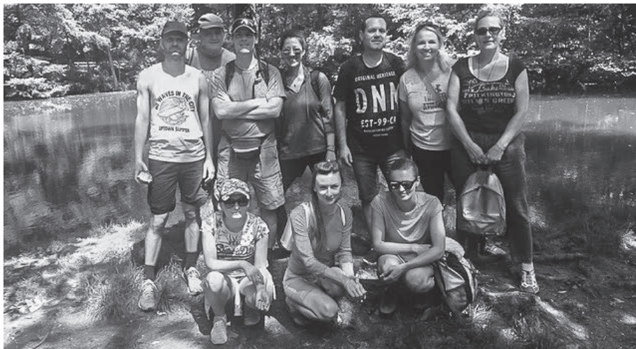
Krátka zastávka na fotenie