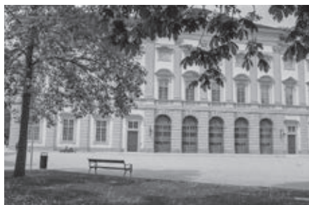
Záhradný palác Gartenpalais Liechtenstein