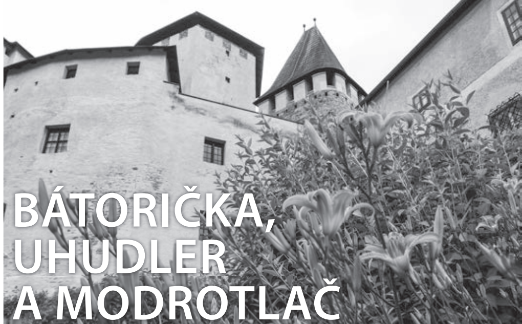
Impozantné múry hradu Lockenhaus