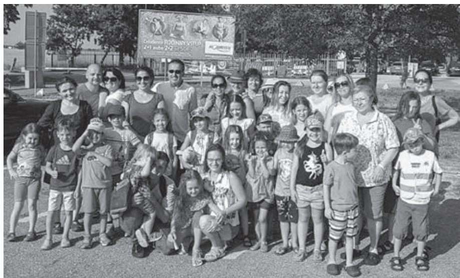
Výletníci v Senci