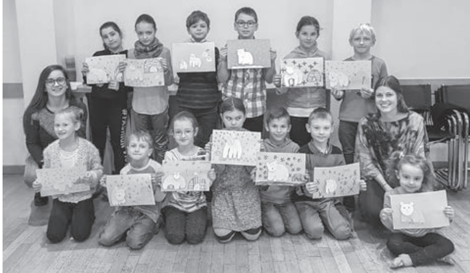
Koniec školského roka v SOVE

Prvá zastávka Modra – hrnčiarstvo a keramika. Nazdávam sa, že asi každý si raz chcel vyskúšať ten otáčací kruh, tú hmotu, tú mokrú