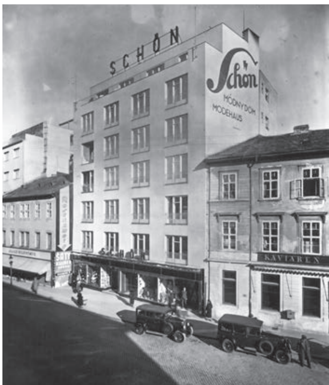
Obchodný dom Schön, Bratislava