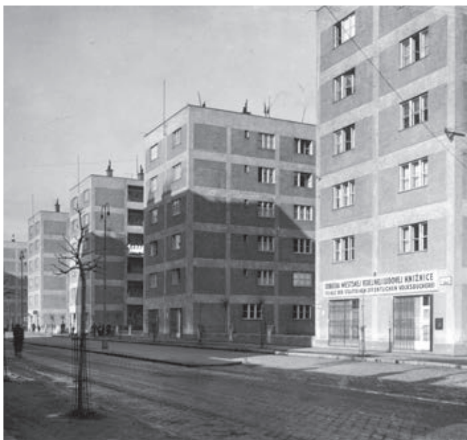
Obytný súbor Unitas, Bratislava, 1932