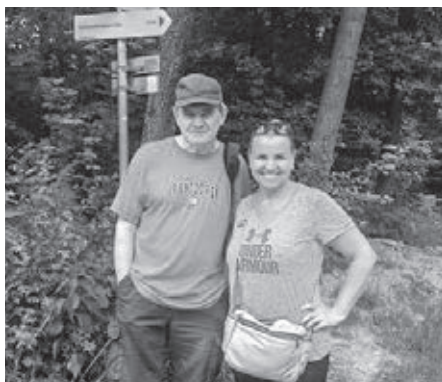
Vždy s úsmevom - aj na túre

Aj keď ranná búrková činnosť niektorých prihlásených odradila, počasie sa našťastie neskôr umúdrilo a slniečko nám robilo spoločnosť počas celej túry. Východiskovým miestom bola Sankt Anna Kapelle na konečnej električky č. 43, odkiaľ sme vyrazili okolo jedenástej. Cieľom našej túry bola reštaurácia Sophiealpe na hrebeni Viedenského lesa (Wienerwald) vo výške 460 metrov n. m. Trasa viedla cez Schwarzenbergpark, Viedenský les, kopec Hameau 464 m n. m. a kopec Exenberg 514 m n. m. Po približne 6,5 km mierneho stúpania prevažne lesnými cestičkami sme po dvoch hodinách dorazili k Sophiealpe. Spálené kalórie sme si