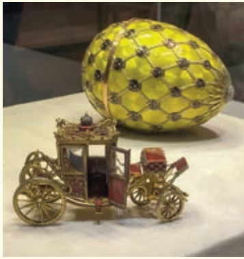
Jedno zo slávnych Fabergého vajčiek