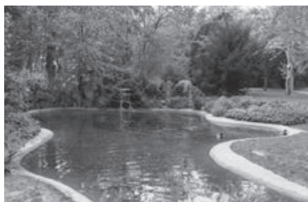
Pozostatok z kaskád a jaskýň z obdobia baroka