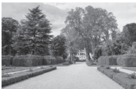
Baroková záhrada prechádza do anglického parku