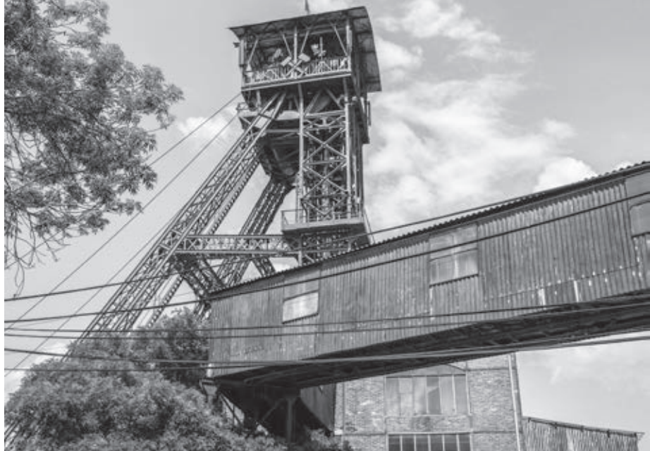
Baňa Michal - národná kultúrna pamiatka

Už dávno neplatí, že k vyhľadávaným turistickým atrakciám patria len hrady, zámky či katedrály. Pri mojej nedávnej ceste do susedných Čiech som sa tak trochu vrátila naspäť v čase. Spomenula som si na mapu Československa, ktorá kedysi visela na tabuli v našej triede na hodinách zemepisu. Jednou z najpriemyselnejších oblastí našej vtedajšej vlasti bol práve Moravsko-sliezsky kraj.