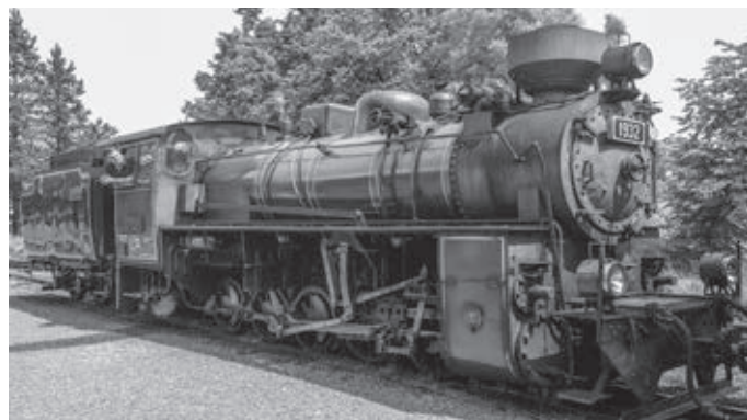
Osoblaha: ide vláčik ši-ši-ši, odvezie nás k Maryši