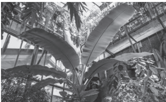
Skleník s tropickými rastlinami

aj kultúrne rastliny. Ako prvý na svete popísal niektoré rastliny, huby a živočíchy. Podľa medzinárodného indexu názvov rastlín až 65 nesie po ňom druhové meno, napríklad horská rastlina Ostropysk – Oxytropis jacquinii .