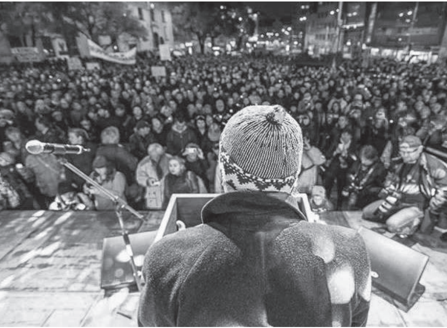
Opäť na tribúne - Ján Budaj s čiapkou známou ako "budajka" v roku 2016

máme symbol štátu, ktorý sa pyšne skvie na eurominci. Druhým občianskym bojom bol náš boj o cintoríny. To boli tvrdšie konflikty. Režim nás označil za nepriateľov, vyšetrovali nás a zatýkali, vyhrazali sa politickým procesom. Poničili historické múry, kaplnky a rodinné hrobky elity tohto mesta, vyviezli tisíce hodnotných pomníkov, ale pod našim vytrvalým tlakom ustúpili – a cintoríny prežili. Verím, že z Ondrejského cintorína bude napokon nový Národný cintorín.