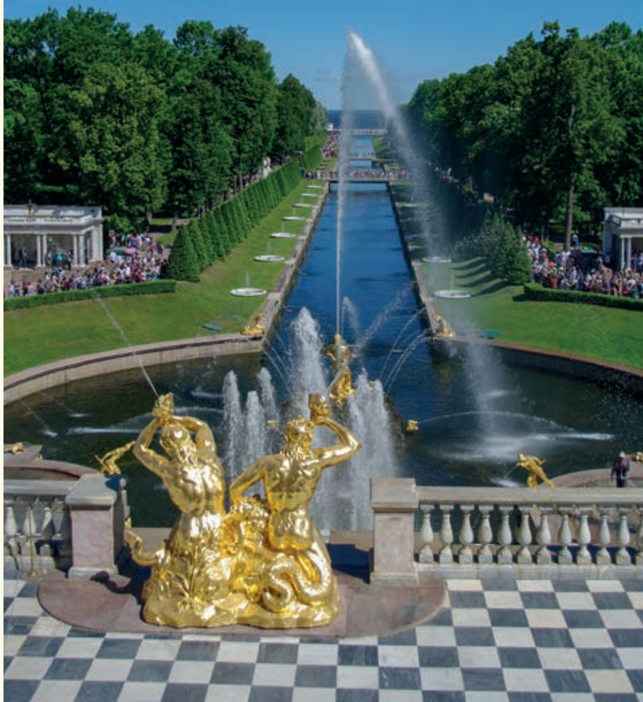
Neptúnova fontána v palácovom komplexe Peterhof - "ruské Versailles"