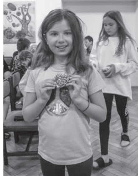
Katkin krásny medovníček

Zobudili sme sa do krásneho horúceho rána a hneď po raňajkách sme sa vrhli na veselé súťaženie. Čaká nás horúci deň, preto sú pripravené vodné súťaže – lovenie v jazierku, hádzanie vodných balónov, prenášanie vody