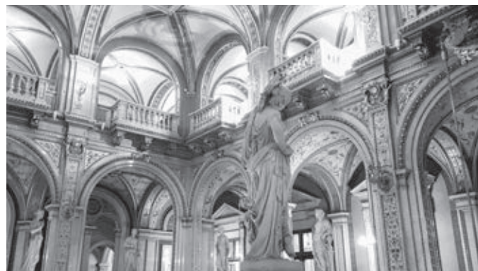
Vestibul ešte aj dnes žiari pôvodnou krásou