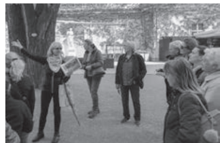
Výklad sprievodkyne s ilustráciami barokového maliara Canaletta