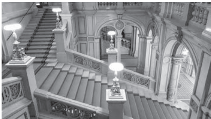
Slávnostné schodište odolalo bombardovaniu